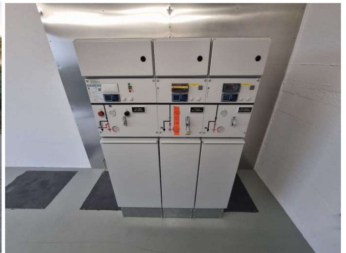
Neue MS Anlage Siemens 8DJH (Ersatz für Unifluorc)