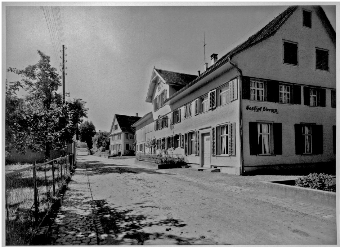
Restaurant Sternen 1945