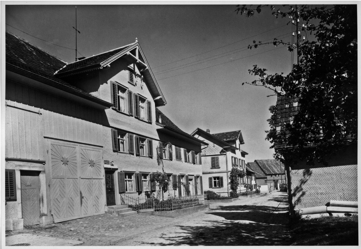
Restaurant Sternen 1945