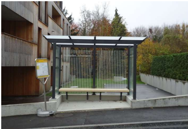
Haltestelle in Richtung Ermatingen

(di) In den letzten Monaten wurden die beiden Postauto-Haltestellen „Schreinerei“ in Fruthwilen behindertengerecht ausgebaut. Gleichzeitig wurden in beide Richtungen Wartehäuschen mit Sitzgelegenheit aufgestellt. So können sich die Fahrgäste künftig auch bei schlechter Witterung im Trockenen auf ihre Busfahrt freuen.