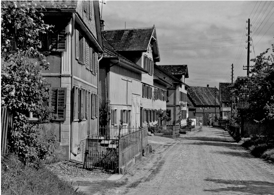
Restaurant Sternen 1946