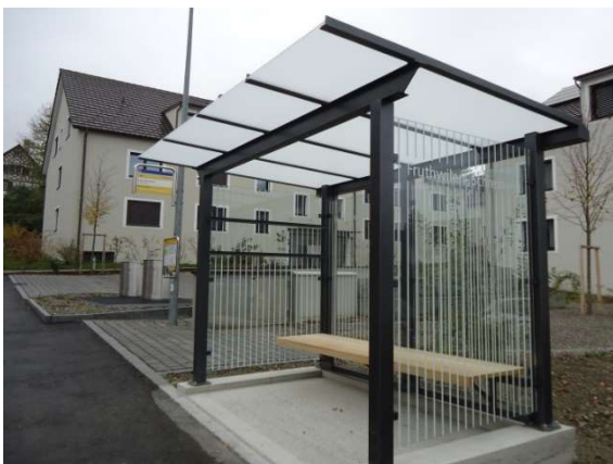
Haltestelle in Richtung Weinfeldern