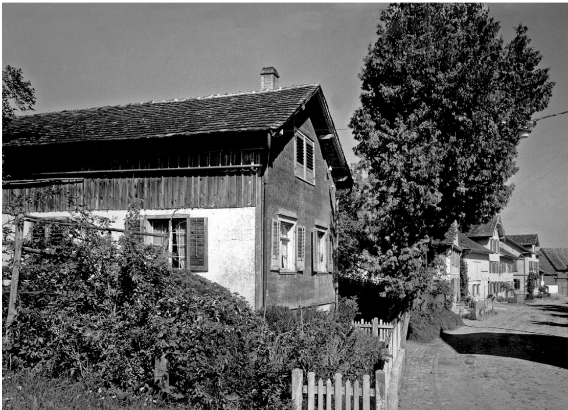
Sternengasse 1945 (heute Eugensbergstrasse)