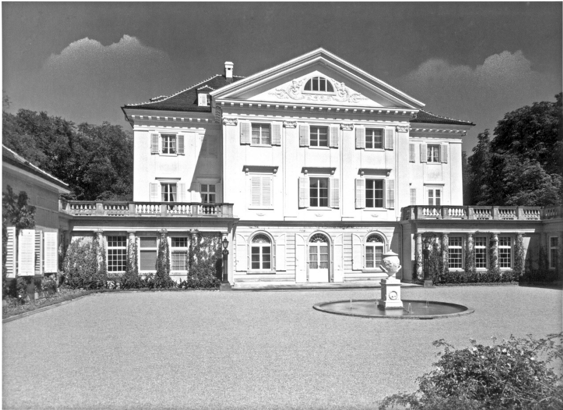
Schloss Eugensberg 1941