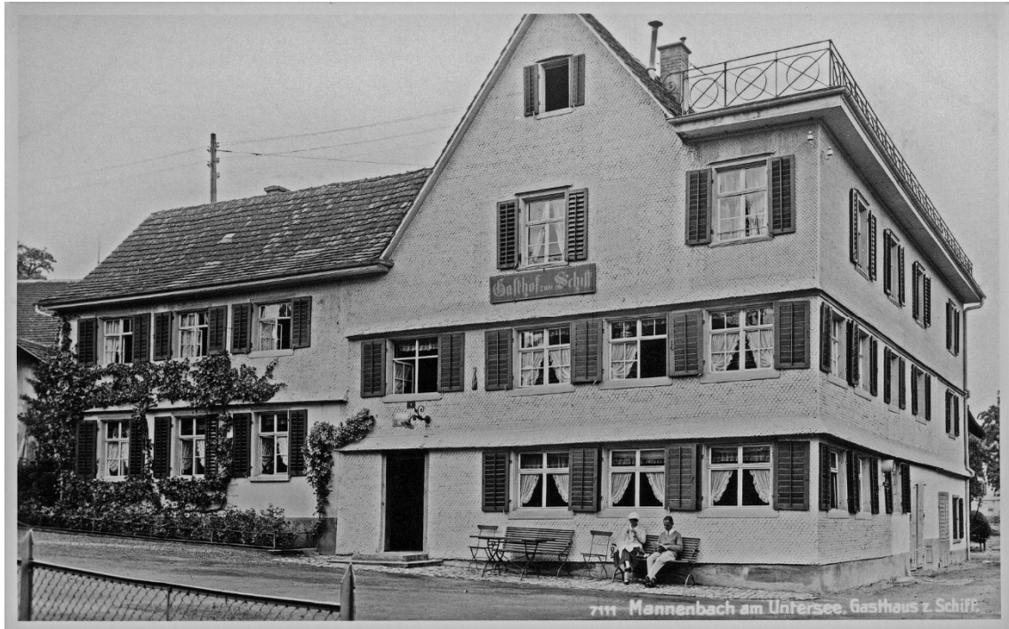
Hotel Schiff 1933