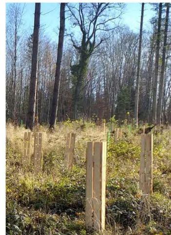
Frisch gepflanzte Bäume müssen gegen Wildverbiss geschützt werden.

Durch den Borkenkäfer sind grosse Flächen entstanden, die eine fachgerechte, zukunftsgerichtete Wiederbewaldung benötigen. Der Revierförster berät Sie gerne bei der Anlage eines klimagerechten Waldes mit standortgerechten, trockenheits- und wärmetoleranten Baumarten.